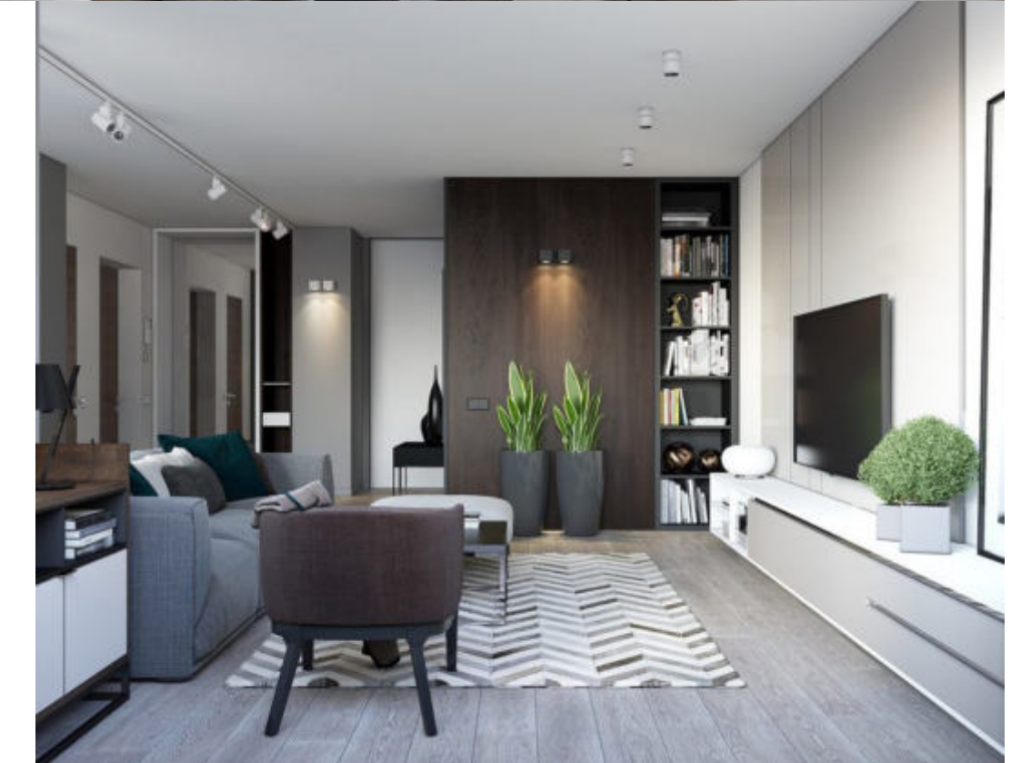
* Пример архитектурного проекта